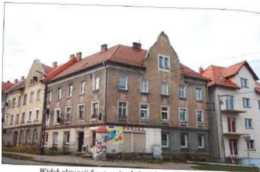
Widok elewacji frontowej – ul. Jarosława Dąbrowskiego.

na sprzedaż lokalu mieszkalnego Nr 9, znajdującego się w budynku położonym w Lubaniu przy ul. Jarosława Dąbrowskiego 19 wraz z udziałem we współwłasności nieruchomości gruntowej (działka nr 76, AM 5, Obręb V o powierzchni 216 m 2 , JG1L/00015868/0)